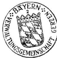
Konrad Hartshauer Gemeinschaftsvorsitzender

Im Internet veröffentlicht am: 20.05.2026